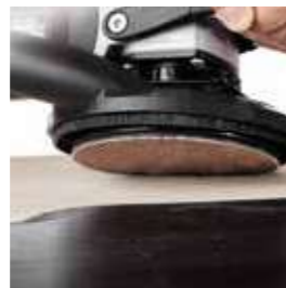
Abranet® Ace HD Abtragsrate