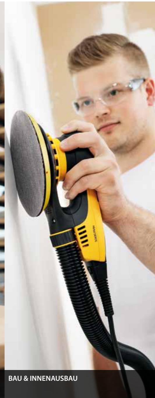
BAU & INNENAUSBAU