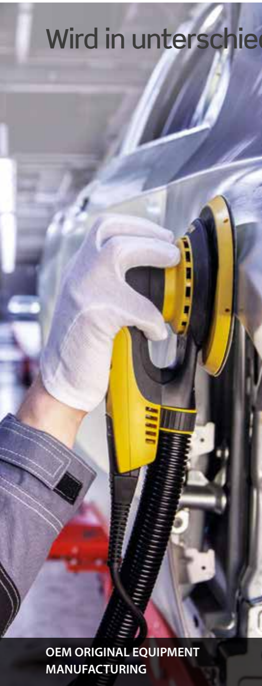
OEM ORIGINAL EQUIPMENT MANUFACTURING

Wird in unterschiedlichsten INDUSTRIEN eingesetzt