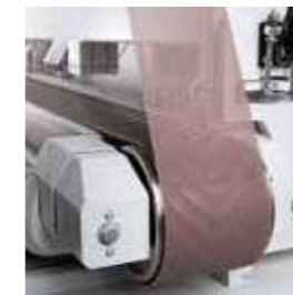
Abranet® Max Kühler Schliff