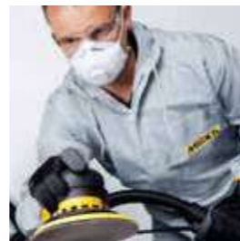
OSP Optimierter Schleifprozess