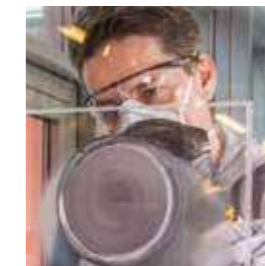
Abranet® SIC NS Siliziumkarbidkörnung