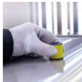
Abranet® Soft Weich und anschmiegsam