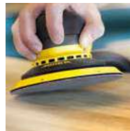
Abranet® Ace Keramische Körnung