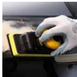
Abranet® Das Original-Netzschleifmittel

Mittlerweile ist die Produktfamilie um einige neue Mitglieder angewachsen. Und wir gehen davon aus, dass wir in naher Zukunft mit weiterem Zuwachs rechnen können.