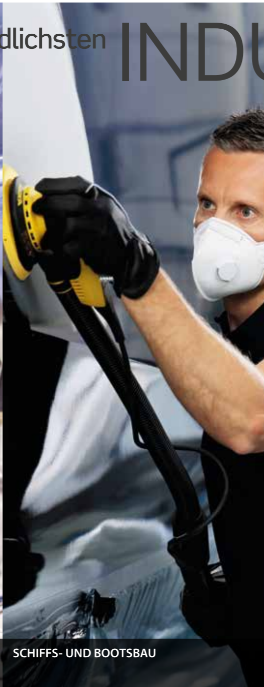
SCHIFFS- UND BOOTSBAU