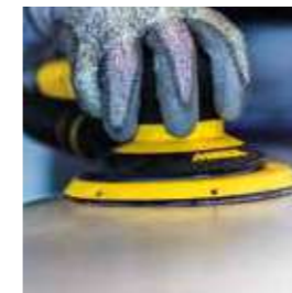
Abranet® NC Korrosionshemmend