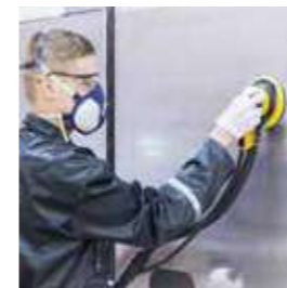
Abranet® NS Stearatfrei